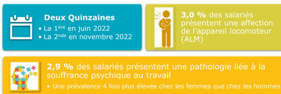
Prévalences redressées des deux principales MCP en Nouvelle-Aquitaine en 2022 (en % et IC*)